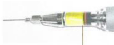
Indstilling af dosering