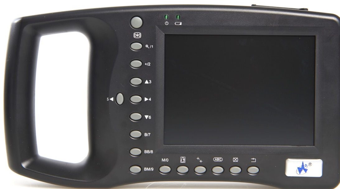
Forsiden på WED-2000AV