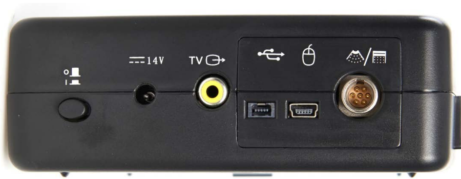
Stikkene på siden af WED-2000AV