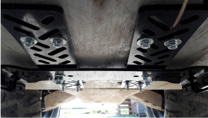
Figur 4: Samling

Fastgør beslaget til hovedpladerne. Spænd nu alle samlinger.