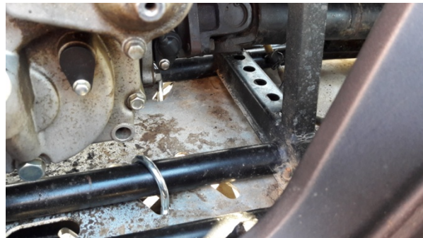
Figur 2: Set ovenfra, bøjler