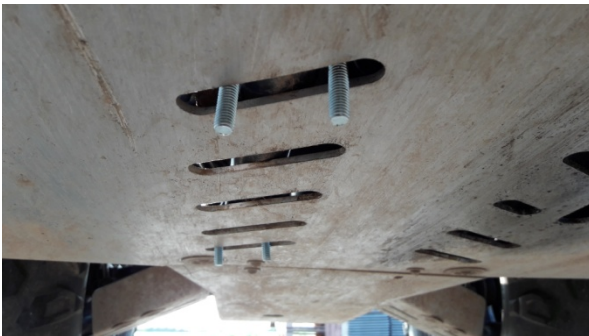
Figur 1: De første par bøjler er sat i

Sæt beslagene på hoveddrammens støtterør. Hvis der ikke er skåret huller i beskyttelsespladen, som i figur 1, skal den tages af.